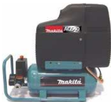
Compressore makita AC640 1460 W