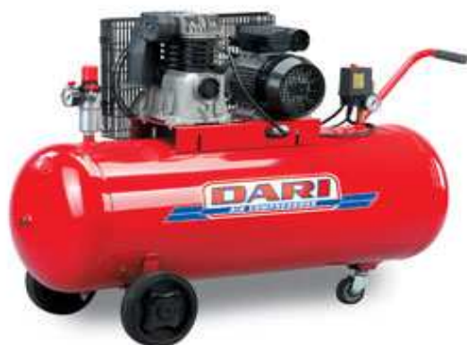
Compressore Dari 200 litri