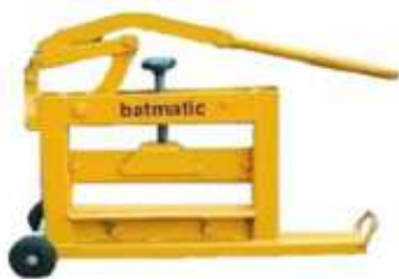
Trancia manuale per autobloccanti