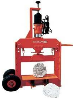
Testa taglia sassi TS 500